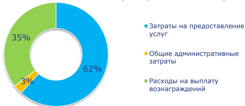
Фактическое распределение затрат