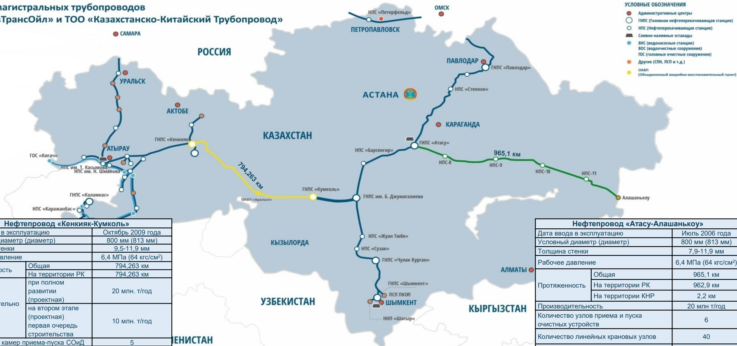
Схема магистральных трубопроводов АО «КазТрансОйл» и ТОО «Казakhstanско-Китайский Трубопровод»